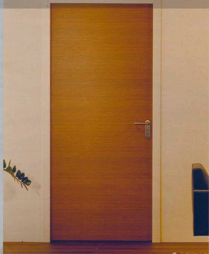
Photo : Porte REVER avec décor NDD bois en option