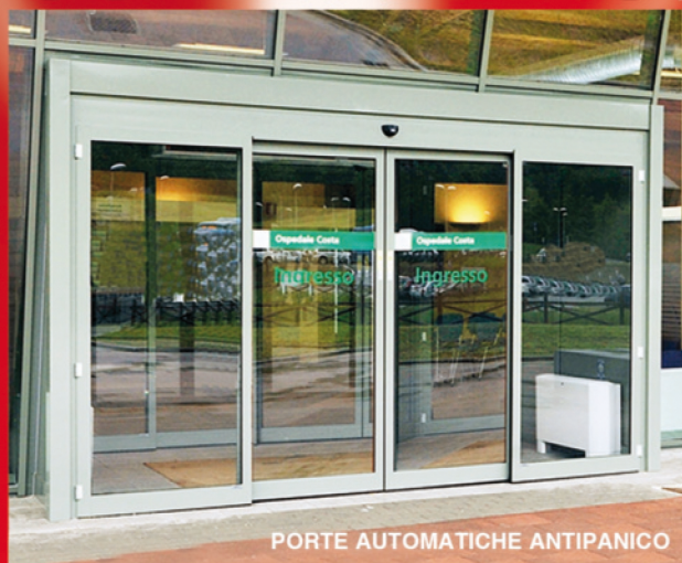
PORTE AUTOMATICHE ANTIPANICO