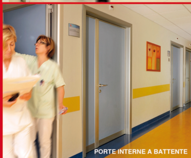
PORTE INTERNE A BATTENTE

BAGNARA-RA ROMA ☎ 0545 76009 ☎ 06 88566005