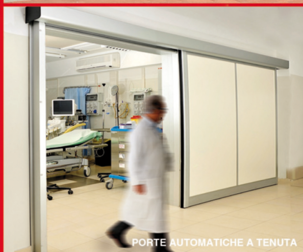
PORTE AUTOMATICHE A TENUTA